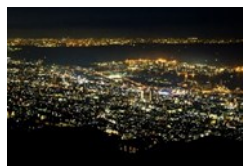
六甲山からの夜景